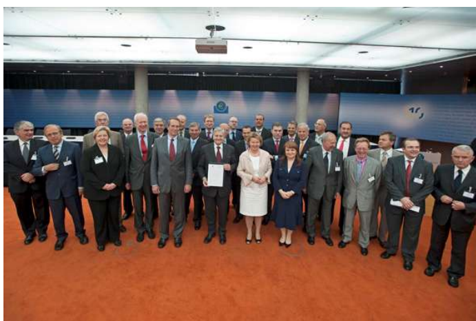
MoU-Unterzeichnung am 16. Juli 2009 in der EZB

Das Direktorium sowie ein Großteil der Mitglieder des EZB-Rates nahmen an der Zeremonie teil.