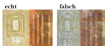
SEHEN (gegen eine gute Lichtquelle betrachtet)

Für alle, die ihre Kenntnisse zu den Sicherheitsmerkmalen vertiefen möchten, besteht die Möglichkeit an Bargeldschulungen teilzunehmen. Diese werden von