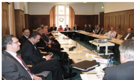
Infoveranstaltung Euro-Zahlungsverkehr in Innsbruck am 15. April 2008

Wir danken unseren Lesern herzlich für die zahlreiche Rückmeldung auf unseren Feedbackbogen und möchten den Gewinnern